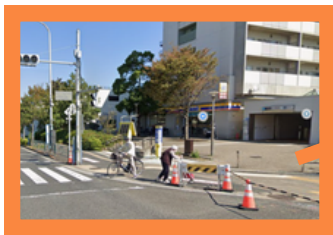
都バス「南砂町駅前」 停留所手前付近